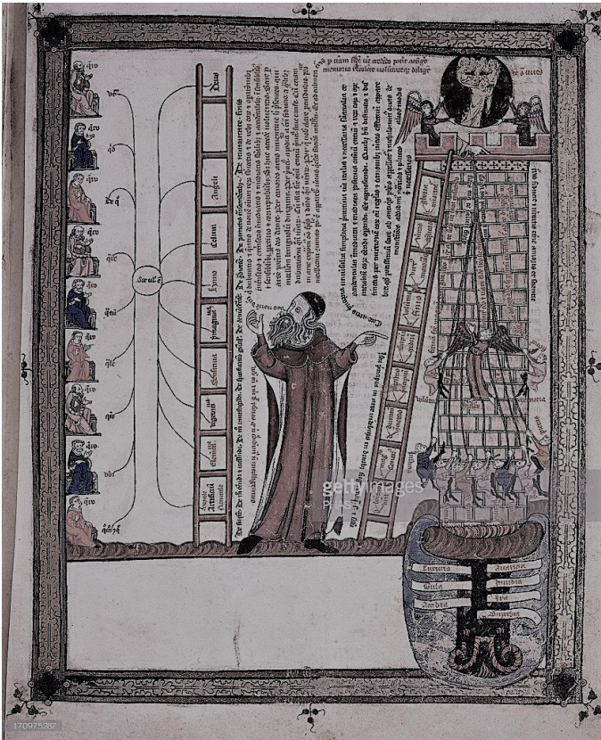
Illuminura V do Breviculum (c. 1325, St. Peter perg. 92, folio 5r). Baden Memorial Library, Karlsruhe, Alemanha.