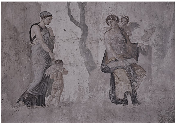
Afresco (séc. I), 154 x 116 cm, Museu Arqueológico Nacional de Nápoles (inv. n. 9257). Pompéia, Sala LXXI, Casa do amor punido .