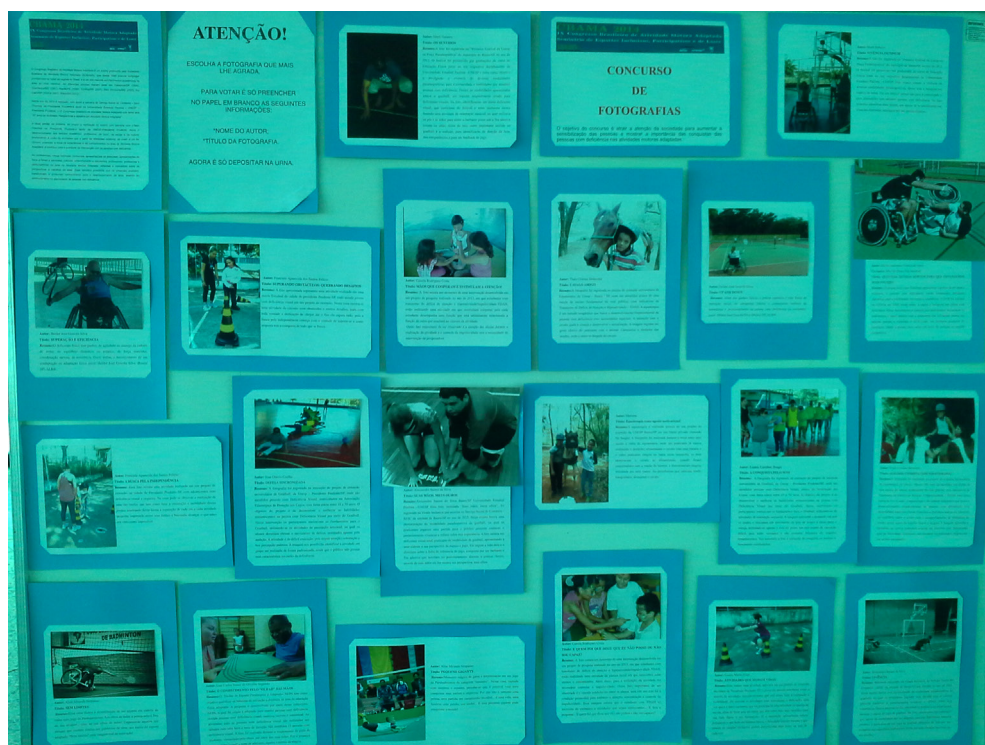
Figura 7 – Concurso de fotografias do IX Congresso Brasileiro da Associação Brasileira de Atividade Motora Adaptada e Seminário de Esportes Inclusivos – SESC – Presidente Prudente/SP