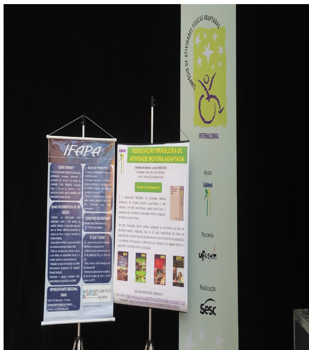
Figura 23 – SOBAMA e IFAPA no Simpósio Internacional de Atividades Físicas Adaptadas – SESC – São Carlos/SP