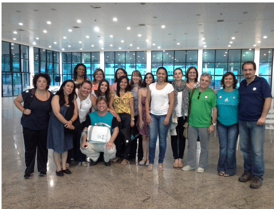
Figura 6 – Participantes da Assembleia durante IX Congresso Brasileiro da Associação Brasileira de Atividade Motora Adaptada e Seminário de Esportes Inclusivos – SESC – Presidente Prudente/SP

No dia 23, durante o evento, foi realizada Assembleia, em que se reuniram os estudiosos da área para discussão dos encaminhamentos da SOBAMA (Figura 6).