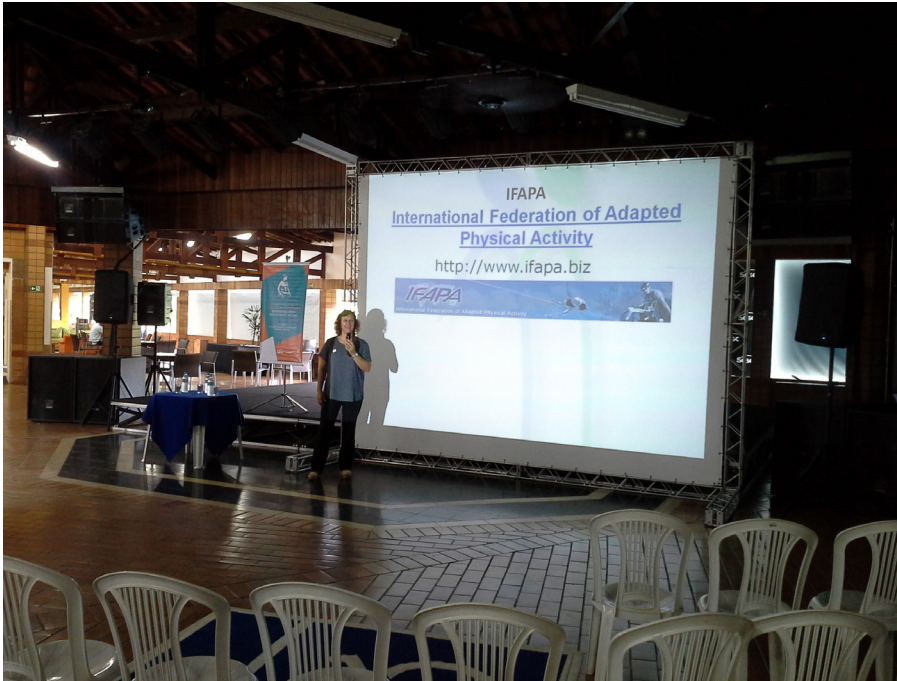
Figura 12 – IFAPA no IX Congresso Brasileiro da Associação Brasileira de Atividade Motora Adaptada e Seminário de Esportes Inclusivos – SESC – Presidente Prudente/SP