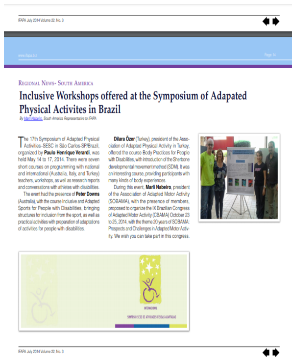
Figura 4 - Boletim de julho de 2014 do IFAPA