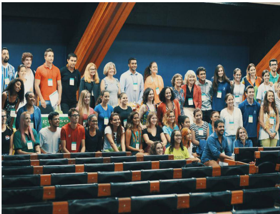
Figura 21 – Palestrantes e participantes do X Congresso Brasileiro da Associação Brasileira de Atividade Motora Adaptada e I Simpósio Internacional de Atividade Física e Saúde – UNICAMP