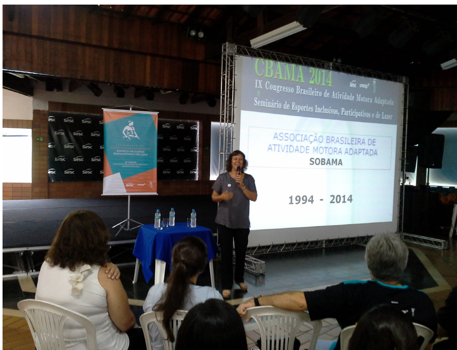
Figura 11 – Retrospectiva de 20 anos da SOBAMA

A presidente de 2014, como membro fundadora da Sobama em 1994, apresentou uma retrospectiva da história da Sobama, com o relato dos acontecimentos de todo o período dos 20 anos em que ela se manteve e mantém envolvida com a Associação (Figura 11).