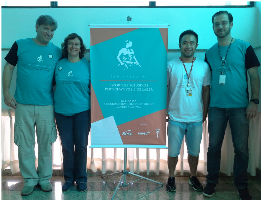
Figura 5 – IX Congresso Brasileiro da Associação Brasileira de Atividade Motora Adaptada e Seminário de Esportes Inclusivos – SESC – Presidente Prudente/SP