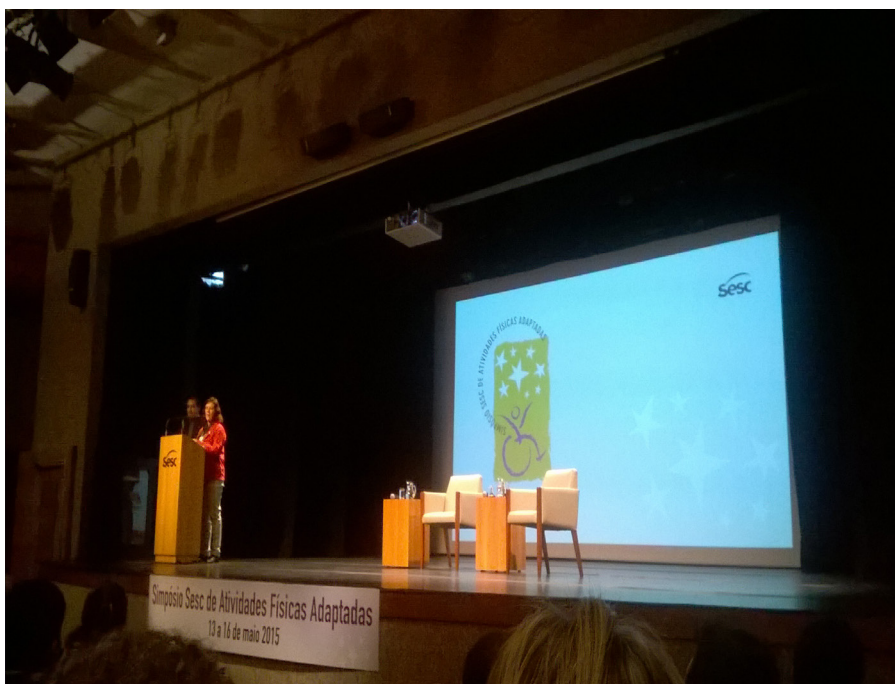
Figura 15 – SOBAMA no Simpósio Internacional de Atividades Físicas Adaptadas – SESC – São Carlos/SP

Em 2015, a Sobama apoiou e esteve presente na cerimônia de abertura do Simpósio Internacional de Atividades Físicas Adaptadas, em São Carlos/SP (FIGURA 15). No dia 15 de maio foi realizada a Assembleia da Sobama, na qual destacamos a indicação dos representantes estaduais, prevista no estatuto, para formação de uma rede de colaboradores na divulgação e ampliação da área.