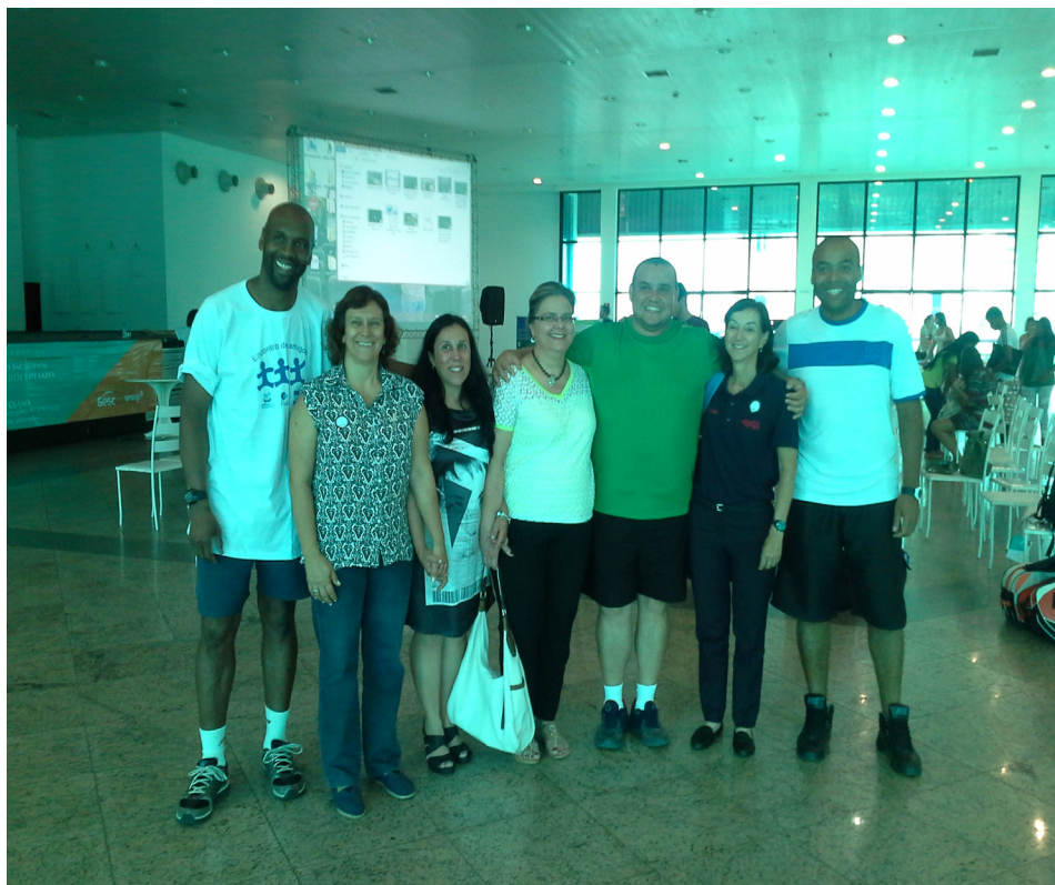
Figura 8 - Convidados e participantes do IX Congresso Brasileiro da Associação Brasileira de Atividade Motora Adaptada e Seminário de Esportes Inclusivos – SESC – Presidente Prudente/SP