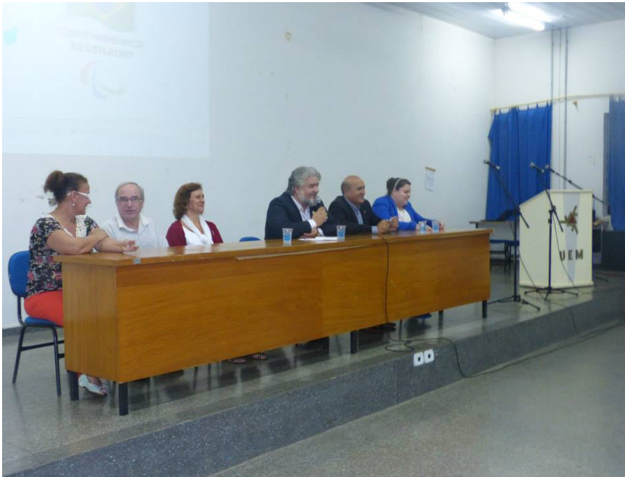
Figura 14 – SOBAMA no II Congresso Paranaense de Educação Física e Esporte Adaptado (2014 - Universidade Estadual de Maringá – UEM)