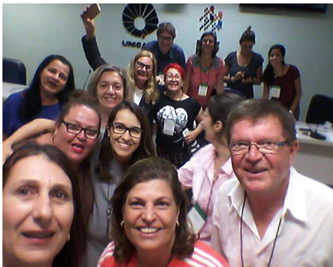
Figura 22 – Participantes da Assembleia da SOBAMA durante o X Congresso Brasileiro da Associação Brasileira de Atividade Motora Adaptada e I Simpósio Internacional de Atividade Física e Saúde – UNICAMP