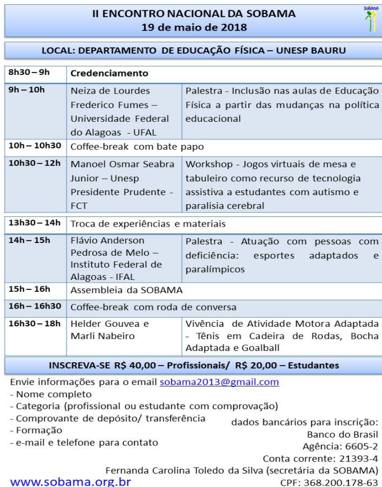
Figura 24 – Programação do II Encontro Nacional da SOBAMA

Em 2018 aconteceu o segundo evento regional promovido pela associação, intitulado II Encontro Nacional da SOBAMA realizado na Unesp de Bauru/SP (Figura 24).