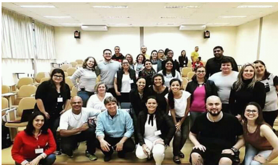
Figura 25 – Palestrantes e participantes do II Encontro Nacional da SOBAMA – UNESP Bauru

Damato. Além disso, ocorreram as palestras, workshop e vivência, em que foi possível realizar as trocas de experiências sempre presentes nos eventos da Sobama (Figura 25).