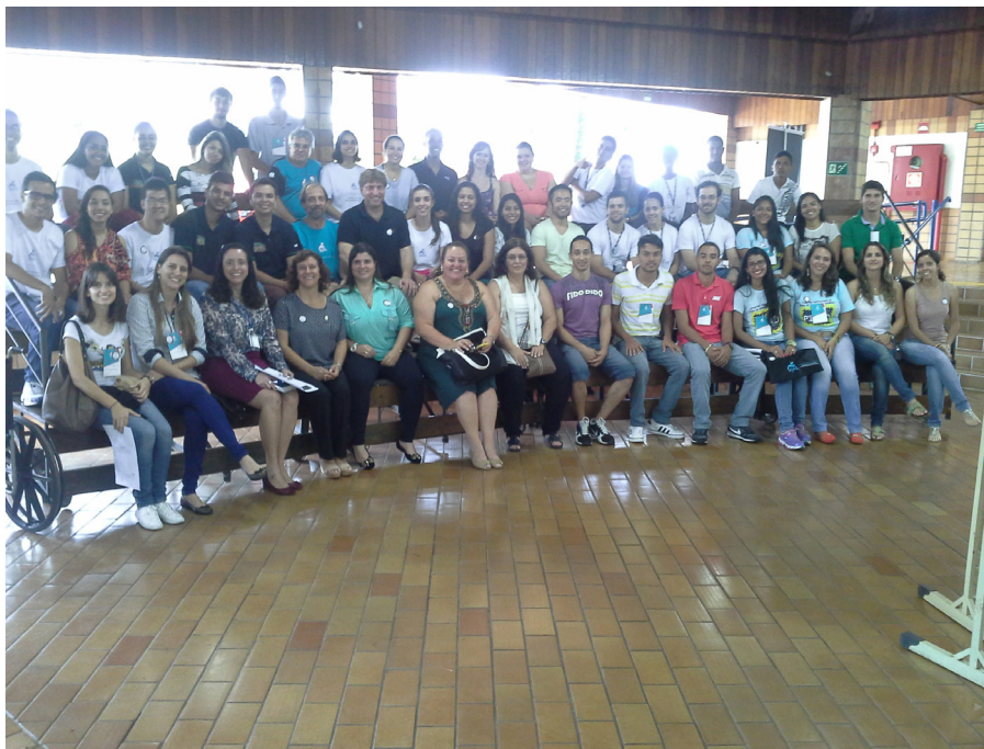
Figura 13 – Encerramento do IX Congresso Brasileiro da Associação Brasileira de Atividade Motora Adaptada e Seminário de Esportes Inclusivos – SESC – Presidente Prudente/SP