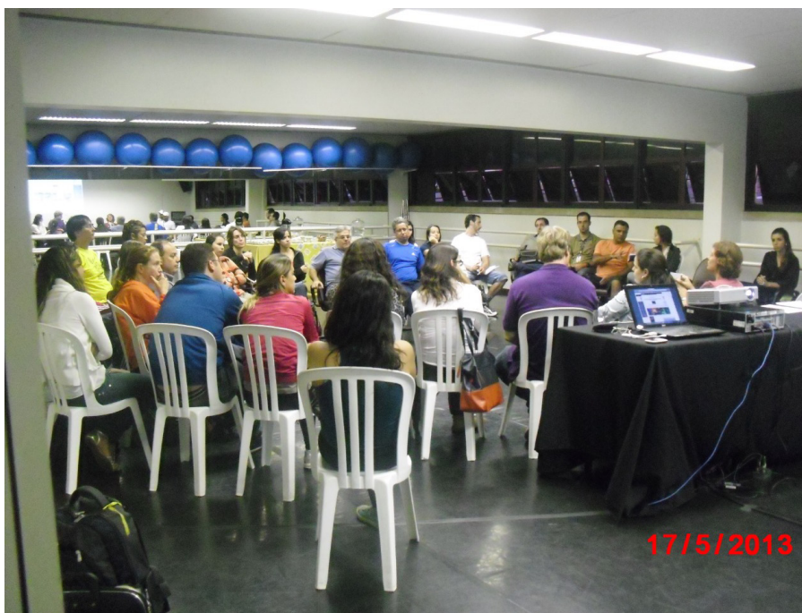
Figura 2 - Profissionais e estudantes reunidos para reestruturação da Sobama