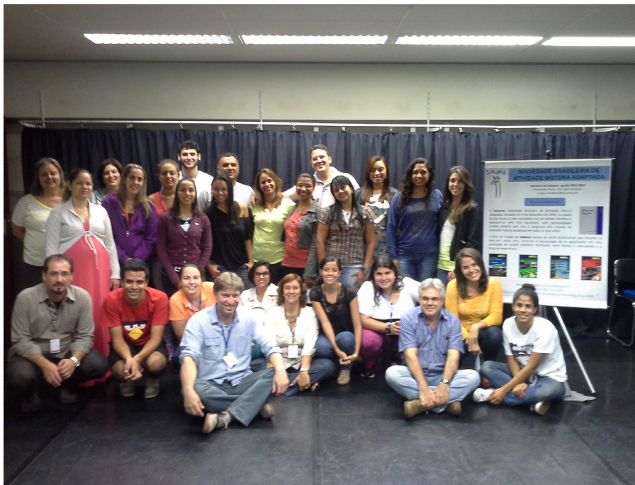
Figura 3 - Participantes da Assembleia durante o Simpósio Internacional de Atividades Físicas Adaptadas – SESC – São Carlos/SP