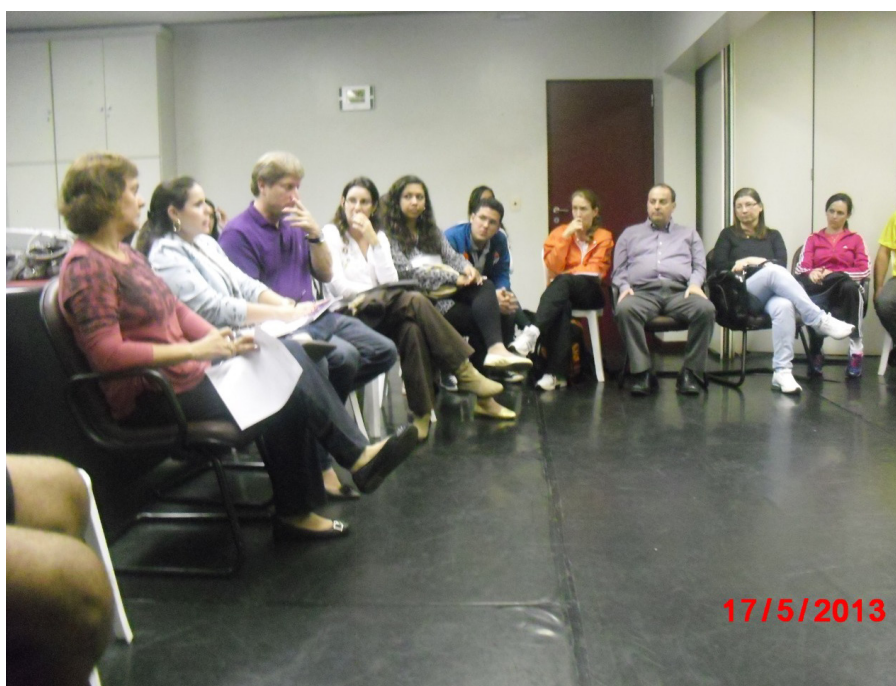
Figura 1 – Reunião com assessoria jurídica para adequação legal da Sobama

Sendo assim, em 2013, organizamos discussões com os sócios, contamos com assessoria jurídica e contábil, e realizamos a adequação legal da Sociedade Brasileira de Atividade Motora Adaptada (Figura 1). Foi necessário ajuste no nome da entidade para Associação Brasileira de Atividade Motora Adaptada, mantendo a abreviatura SOBAMA.