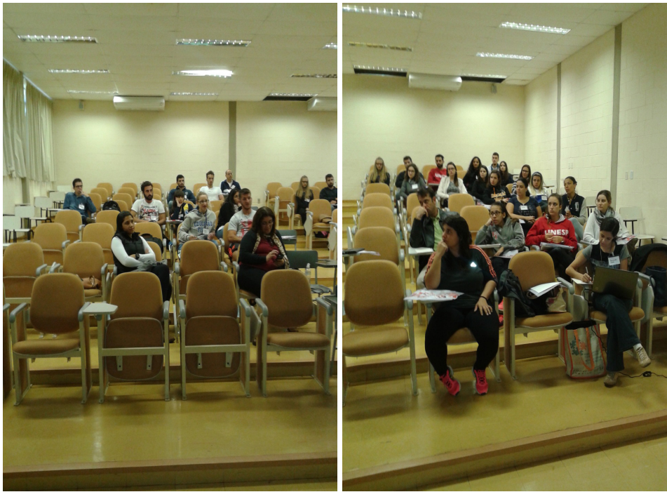
Figura 19 - Assembleia durante o Encontro Nacional da SOBAMA na Unesp-Bauru/SP