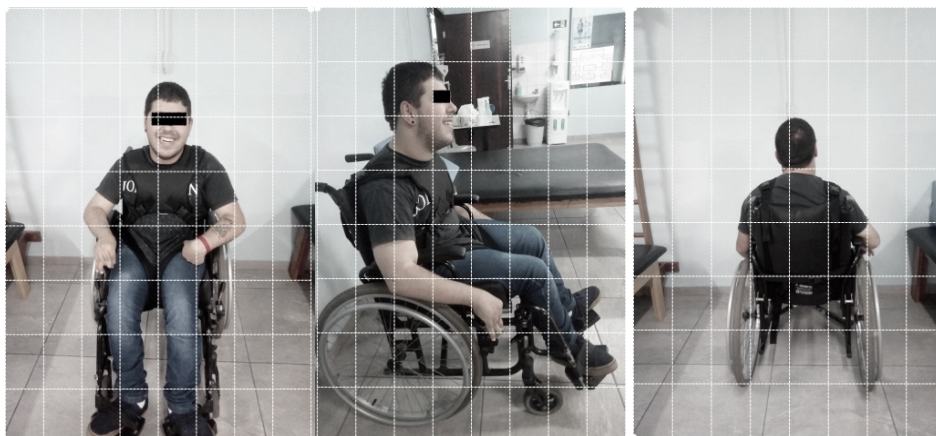
Figura 2 - Voluntário posicionado na cadeira utilizando os recursos de tecnologia assistiva de baixo custo (cinto torácico e pélvico), observado na vista anterior (A), lateral (B) e posterior (C)

Desta forma, após avaliação do voluntário, bem como da observação das reais necessidades encontradas durante a avaliação inicial, os pesquisadores optaram pela utilização do cinto torácico, modelo borboleta em conjunto com o cinto pélvico, modelo calção. A Figura 2 mostra o voluntário observado nas vistas anterior (A) lateral (B) e posterior (C), posicionado na cadeira de rodas utilizando os cintos prescritos.