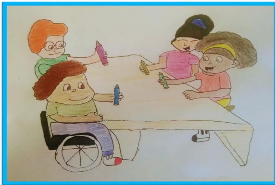
Figura 3 – Senhas para falar