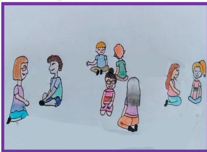
Figura 1 – Círculos concêntricos