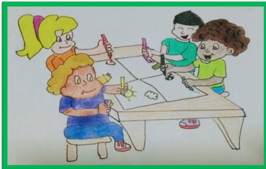
Figura 2 - Grafite Coletivo