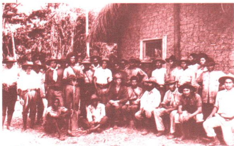
Coluna Prestes: Luís Carlos Prestes e membros da Coluna exilados na Bolívia. Gaíba, fevereiro/abril de 1927.

consciência para ter confiança que fosse possível mudar essa situação. Tanto que uma das ilusões que eu tive era que a Coluna chegando ao Nordeste, onde eu sabia que havia miséria, íamos ter grandes adesões. Não tivemos. Porque o povo nos admirava, nos ajudava às escondidas. Sem se comprometer, podiam nos ajudar. Mas de outra forma... adesões eram muito poucas. Jovens, crianças quase, garotos de 14 a 18 anos, apresentavam-se e entravam para a Coluna. Mas relativamente poucos, muito poucos. Isso foi que me impressionou e me colocou diante do seguinte problema: será que lutar contra o Bernardes é suficiente? A nossa luta, a minha estratégia, o objetivo era exclusivamente esse. Era contra o Bernardes, porque a própria posição política levantada pelo Assis Brasil já em 24 era representação e justiça. Quer dizer, era haver justiça e haver liberdade eleitoral. Mas isso, para nós também não nos interessava. Nós estávamos lutando era contra o Bernardes. E eu disse: “Não vai ser a substituição de Bernardes por outro que vai modificar. Nós estamos diante de um problema social”. Foi aí que eu compreendi. “Estamos diante de um problema social seriíssimo, do qual não conheço as causas e muito menos o remédio.” Os outros companheiros, nós todos conversávamos na Coluna sobre esses assuntos, mas parece que nenhum deles levou a sério essa preocupação em conhecer as causas dessa situação.