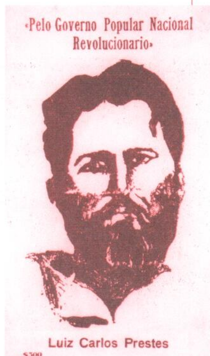
Luís Carlos Prestes