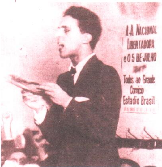
Carlos Lacerda lê o manifesto de Prestes (Aliança Nacional Libertadora) em 5 de julho de 1935.

agrária e antiimperialista. Lutávamos imediatamente já pela desapropriação das empresas imperialistas, contra o latifúndio. De maneira que muitos aliados nossos da Aliança Nacional Libertadora, depois do manifesto, tendiam a romper conosco porque não concordavam com aquilo. Eles eram antifascistas, mas não eram antiimperialistas nem antilatifundiários, entre eles Hermes Lima, por exemplo, chegou até a estar preso durante alguns meses. Esta era a orientação que eu recebi lá. Agradecendo tudo que me ajudaram, eu avancei muito na compreensão do marxismo, mas realmente foi uma compreensão falsa do caráter da revolução nos países da América Latina e, particularmente, no Brasil. Porque não havia especialistas sobre isto..., agora é que está se aproximando um pouco mais dos