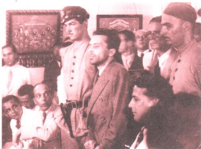
Luís Carlos Prestes na Polícia Especial. Rio de Janeiro, 1936.