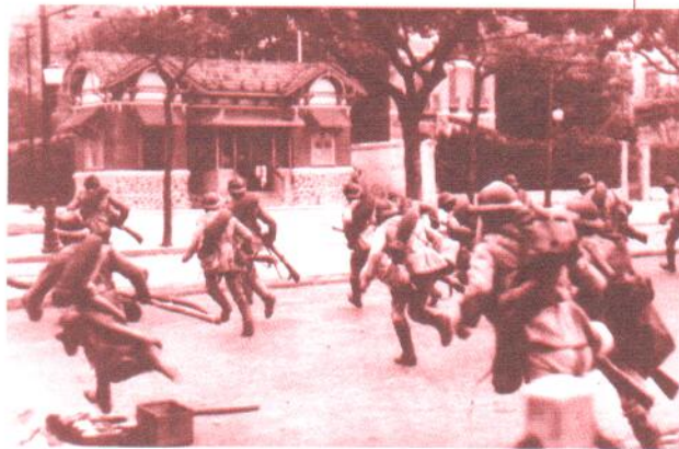
Levante comunista de 1935. Forças legais em assalto ao 3º Regimento de Infantaria, na Praia Vermelha. Rio de Janeiro, 27 de novembro de 1935.