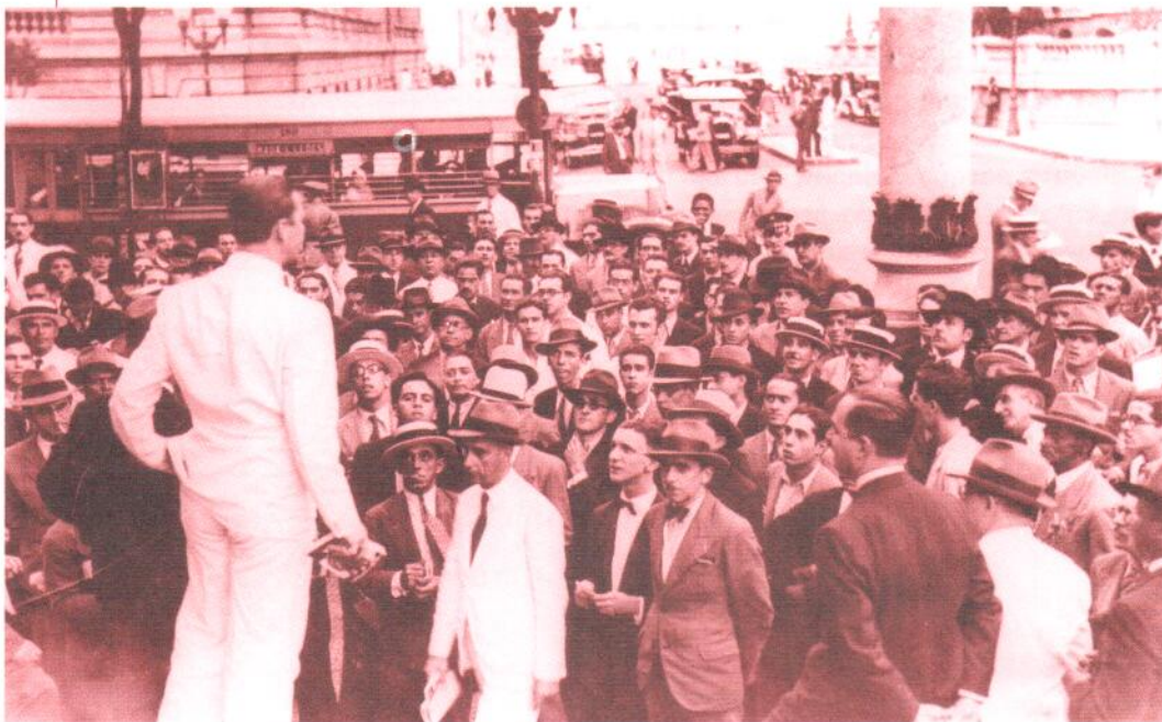
Comício da Aliança Nacional Libertadora (ANL). Rio de Janeiro, 1935.