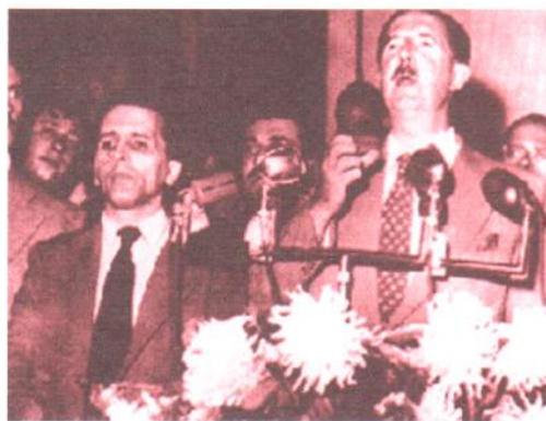
Ademar de Barros e Luís Carlos Prestes