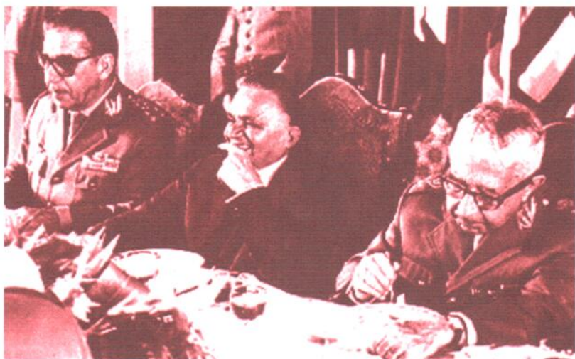
Marechal Mascarenhas de Moraes, general Castelo Branco e general Costa e Silva