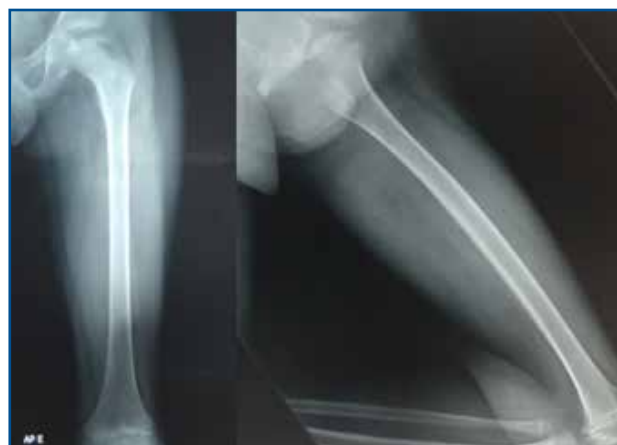
FigureA. 1: Radiografia coxofemoral esquerda – AP/OBLIQUA.

História Progressiva da Moléstia Atual: Diagnóstico clínico de Artrite Idiopática Juvenil, forma oligoarticular. O paciente apresenta quadros de amigdalite e resfriados esporádicos, queixa álgica em membros inferiores (MMII) (quadril, joelho e tornozelo) e coluna lombossacra, discrepância do quadril esquerdo (1 cm) com marcha antálgica. A história progressiva revela início do quadro álgico aos 4 anos de idade, no ano de 2015, seguindo com quadros álgicos e inflamatórios nas articulações do quadril, joelho, tornozelo, coluna lombar e sacral, entre quadros agudos e remissões, ao exame de Ressonância Nuclear Magnética (RNM) de quadril esquerdo (08/08/2015) apresentou necrose avascular da cabeça do fêmur. O diagnóstico clínico de AIJ foi confirmado aos 7 anos apresentando velocidade de hemossedimentação: 14 mm na 1ª hora, valores de referência (VR): 0 a 20 na 1ª hora e proteína C reativa (inferior a 6 mg/dL, VR: negativo - inferior a 6,0 mg/dL) normais e creatinina sérica diminuída (0,43 mg/dL, VR: 0,70 a 1,20 mg/dL) com resposta positiva ao tratamento medicamentoso com metotrexano (10 mg) e prednisolona 5 ml de 12/12h (1mg/ml). Em agosto de 2016, verificou-se aumento de proteína C reativa (0,50 mg/dL, VR: 0 a 5 mm3) e da velocidade de hemossedimentação (11 mm3 na 1ª hora, VR: 0 a 5 mm3), creatinina sérica diminuída (0,49 mg/dL). Ao raio X (06/05/2016) constatou-se impaction, esclerose, irregularidade e deformidade da epífise da cabeça femoral (Figura A.1). O exame de