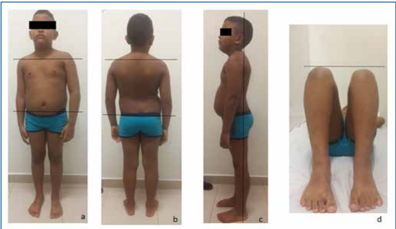
Figura A. 3: vista anterior (a), posterior (b) e lateral (c), discrepância em MMII (d).

Avaliação cinética-funcional: apresentou queixa álgica aos movimentos em quadril e joelho esquerdo e em ortostatismo prolongado, com irradiação para a região anterior de membro inferior esquerdo. Diminuição de força muscular (FM), Flexibilidade comprometida em flexão de quadril esquerdo (100°) e reflexos preservados. Assimetria em MMII com escoliose destro-convexa, hiperlordose lombar, protrusão abdominal, rotação interna de fêmur bilateral, desabamento de arco plantar, com alteração postural global estática (Figura A.3).