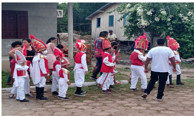
Imagem: Crianças vestidas como mouros

Após o dia 25 de julho, quando acaba a Festa de São Tiago realizada pelos adultos, as encenações e rituais continuam, mas agora tendo as crianças como protagonistas, vestidas de vermelho e branco de acordo com a representação de mouros e cristãos. Nos dias 27 e 28 de julho, elas também executam vários atos como a entrega dos presentes, participam do baile de máscaras mirim e encenam a batalha entre mouros e cristãos, levando consigo cavaleiros ornamentados e decorados com papel de seda feitos de buriti.