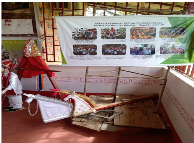
Imagem: Cavalinhos construídos junto as crianças para a festa de São Tiago Mirim