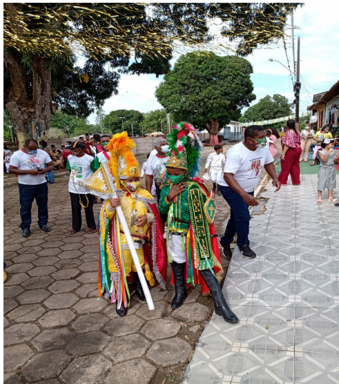
Imagem: Figuras de São Tiago e São Jorge mirins

tradições de celebrações culturais/religiosas dentro de uma comunidade tradicional, especialmente aos saberes construídos a partir da história e do saber local.