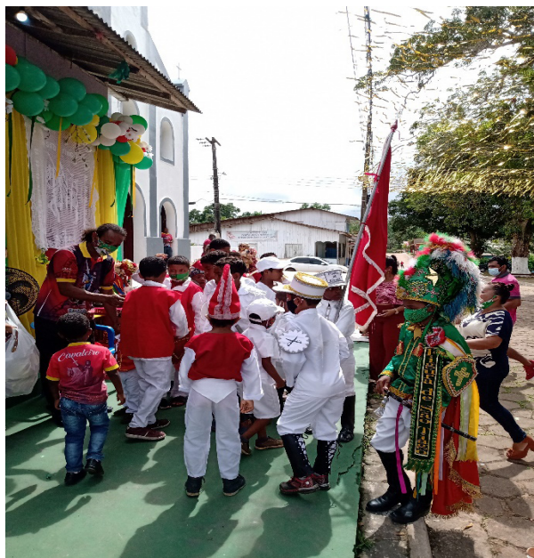
Imagem: A dança do Vominê

Nesse processo ritualístico dentro da Festa Mirim, é realizado o círio das Crianças e a missa direcionada a elas. Assim como na festa feita pelos adultos, é oferecido comida e bebida para os participantes, para as crianças são oferecidos chocolates, guloseimas, nas casas onde dançam o Vominê (dança da vitória após a guerrilha). Dessa forma, a festa mirim torna-se uma manifestação social, uma expressão coletiva, o que integra o aspecto social e cultural dentro do cotidiano das famílias.