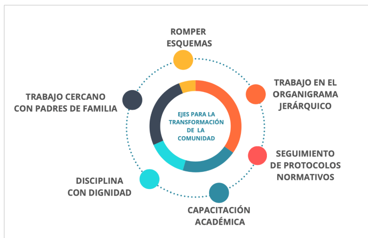
Figura 1 - EJES de transformación institucional