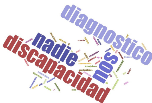
Figura 3 - Nube de palabras circulares

Para el análisis cualitativo nos basamos en el relevamiento de los comentarios y opiniones expresados verbalmente y aquellos que fueron escritos en el chat de la plataforma Zoom, buscando que aporten a la comprensión del tema recogimos de los diferentes encuentros categorías cualitativas y nos concentramos en aquellas frases o comentarios que se repetían en todos los encuentros o en la mayoría de ellos, luego el equipo conformado por docentes y estudiantes analizando las implicancias de cada uno de ellos, llegando a identificar tres factores característicos del ciclo de encuentros. A modo de representación se comparten las frases más repetidas por los participantes y expositores (Figura 3)