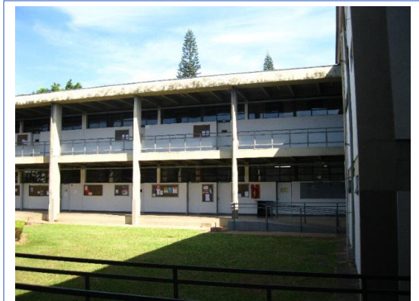
Figura 1 – Faculdade de Filosofia e Ciências da UNESP, Campus de Marília