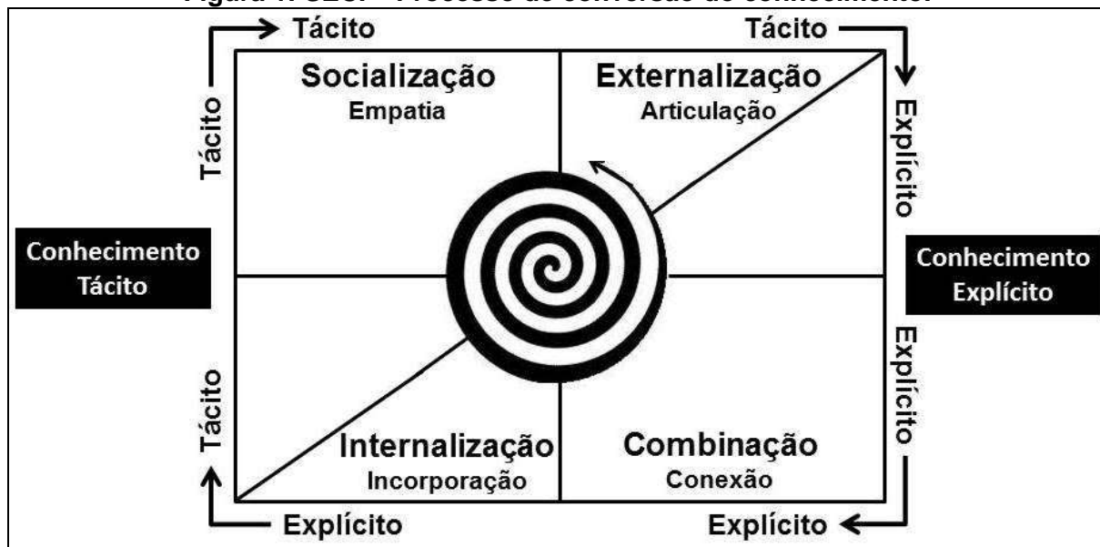
Figura 1: SECI – Processo de conversão do conhecimento.