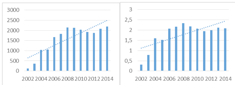
Figura 1 – China: Participação em OPNU 2002-2014 (números absolutos e % de participação)

primeiros lugares no referido ranking . Cabe ressaltar que, dentre os membros permanentes do CSNU, a China é o mais representativo nas OPNU.