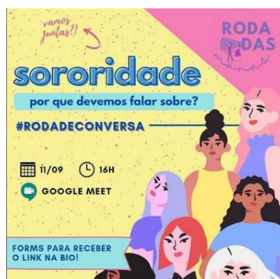
Figura 2 – Sororidade – Coletivo Bertha Lutz

5