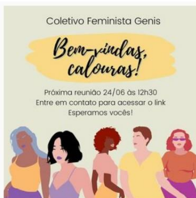
Figura 1 – Calouras - Coletivo Genis