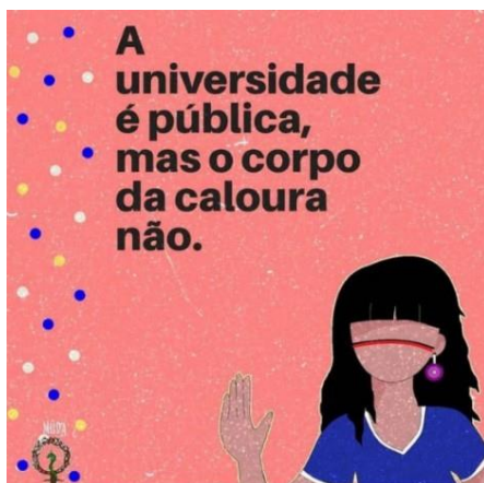
Figura 3 – Corpo da caloura – Muda/UNICAMP