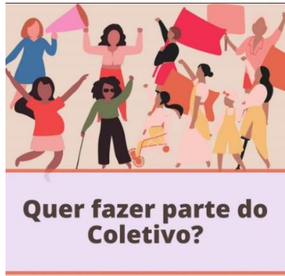
Figura 4 – Convite - Coletivo Leilane Assunção

Fonte – Perfil do coletivo no Instagram 8