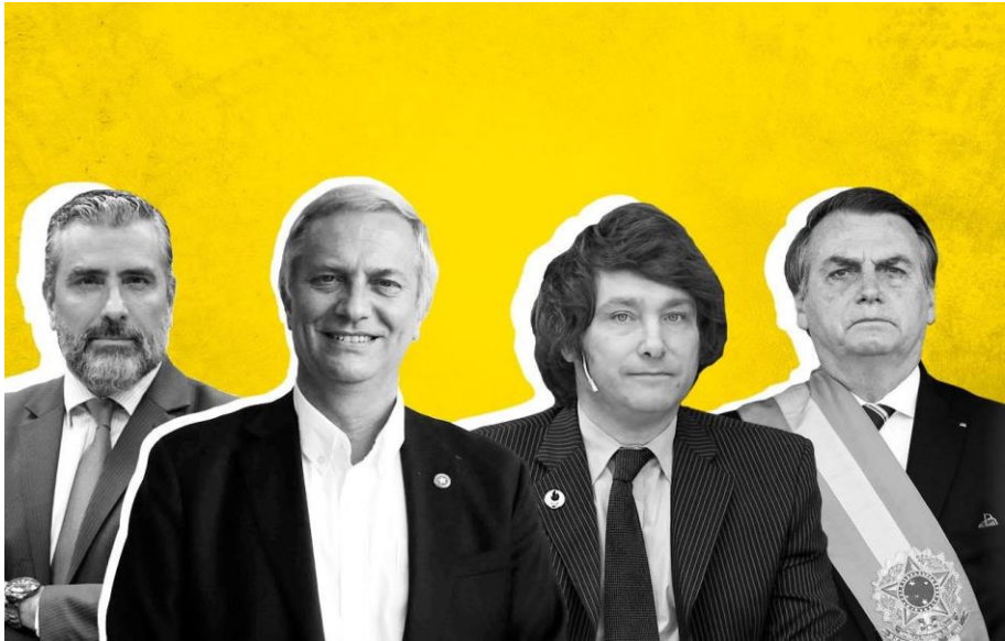
Imagen 3. La derecha radical

Se crea un comité de expertos, que representan exclusivamente a los partidos con representación parlamentaria, cuya función es fijar los bordes de la nueva propuesta, esto no es otra cosa, que eliminar el riesgo de que se vuelvan a colar las ideas subalternas, nada de plurinacionalidad, aborto como soberanía femenina, sistemas diferenciados de justicia, relativización de la propiedad privada, etc. En adición, una elección directa de consejeros constitucionales, sin infiltración de independientes, nada de riesgos.