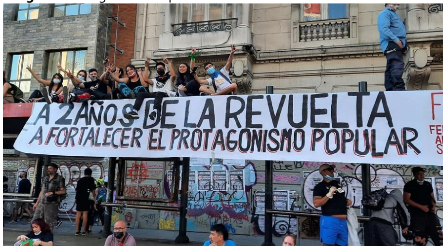
Imagen 1. Protagonismo Popular