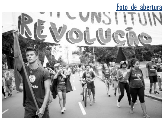
“O Estudante e a Revolução” [2018] Porto Alegre - RS [Brasil]

Para a artista, todas as escolhas de enquadramento são políticas e narrativas, todo apertar de botão é também um aprendizado pessoal, uma forma de grito. Nesta perspectiva, para ela o embate corporal do fotógrafo está sempre presente na história que narra e é preciso clareza no que se comunica. Olhos atentos ao discurso que a imagem reafirma.