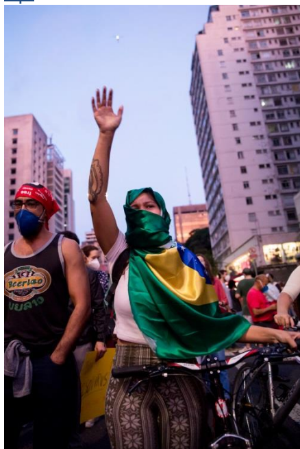
“Vacina no braço e comida no prato” [2021] São Paulo - SP [Brasil]