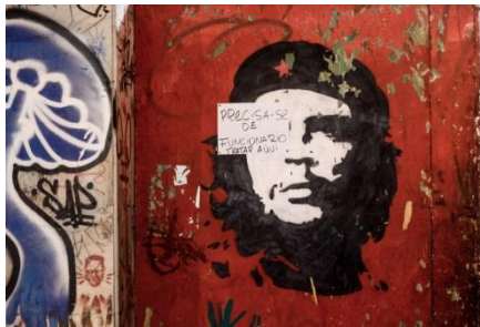
“Precisa-se de funcionário” [2015] São Paulo - SP [Brasil]