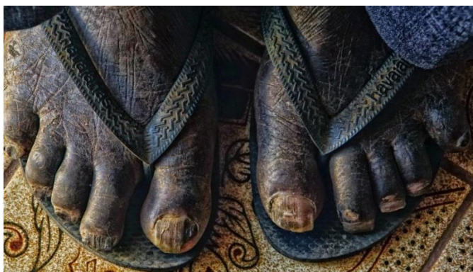
Imagem de encerramento

Vila Bela da Santíssima Trindade — MT [Brasil]