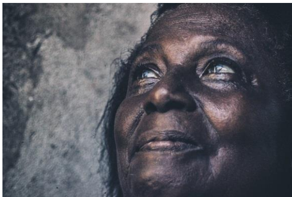
Imagem da contra capa

Era outra até os 27 anos. Em São Paulo acreditava no discurso da meritocracia. Já em Rondônia adquiriu uma câmera fotográfica e no lugar das ideias deu espaço a imagens de uma Amazônia afastada das mentes sudestinas, mas latentes ao lugar e às inúmeras potências antes desconhecidas a seu próprio corpo recém enegrecido.