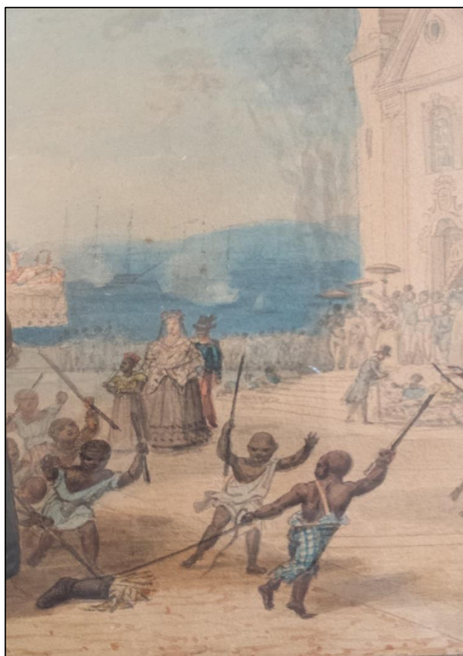
Figura 4: Jean-Baptiste Debret, Queima de Judas. (Detalhe) 1823 - Aquarela sobre papel; 17 x 23,5 cm, Museu Castro Maya, Rio de Janeiro 8 .

Ao fundo, identificamos um homem negro de chapéu, camisa azul e calça vermelha; uma senhora branca de vestido, xale (a qual aparenta ter saído da igreja) e uma menina negra também de vestido, observam de longe o acontecimento do Sábado de Aleluia. Enquanto o homem negro e a menina olham em direção ao Judas, a senhora olha fixamente para os meninos batendo na perna do boneco.