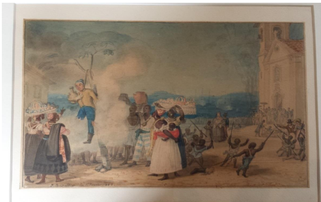
Figura 1: Jean-Baptiste Debret, Queima de Judas . 1823 - Aquarela sobre papel; 17 x 23,5 cm, Museu Castro Maya, Rio de Janeiro 5 .

Segundo Debret, é o primeiro sino da Capela Imperial que anuncia a ressurreição de Cristo e ordena a queima do Judas. Este vilão alegorizado é o centro da festa em um dia santo.