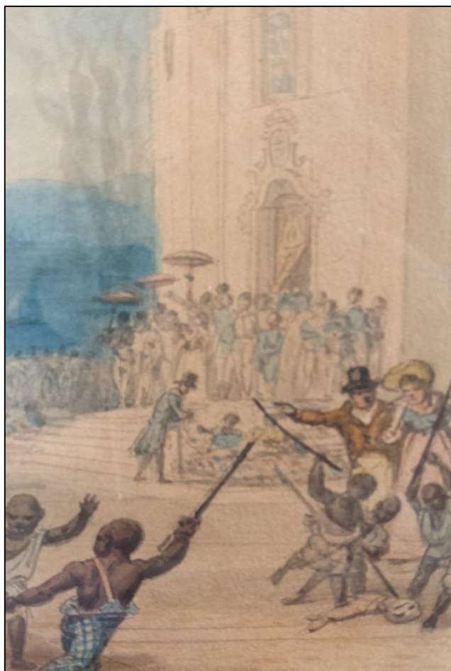
Figura 5: Jean-Baptiste Debret, Queima de Judas. (Detalhe) 1823 - Aquarela sobre papel; 17 x 23,5 cm, Museu Castro Maya, Rio de Janeiro 9 .

Já neste fragmento, ao fundo fiéis saem da igreja, alguns acompanhados de seus escravos que os protegem do sol com sombrinhas. Ao centro, um homem branco de casaco, cartola e bengala, parece conversar com uma mulher na escadaria da igreja. No canto direito um homem acompanha uma senhora, ambos bem vestidos, observam três meninos negros malharem outra parte do boneco do Judas.