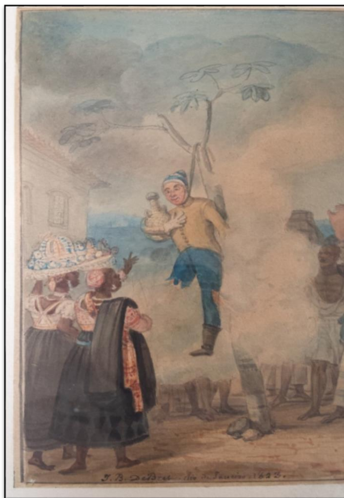
Figura 2: Jean-Baptiste Debret, Queima de Judas. (Detalhe) 1823 - Aquarela sobre papel; 17 x 23,5 cm, Museu Castro Maya, Rio de Janeiro 6 .

Neste detalhe da aquarela, identificamos o boneco (Judas) preso a uma árvore pelo pescoço. Já sem um braço e uma perna, o boneco feito de palha segura com a mão direita um saco (provavelmente, representando o dinheiro). Com uma camisa clara e calça azul, o Judas usa uma bota de montaria na cor escura, luva branca em uma das mãos e um gorro listrado branco e azul. Na descrição de Debret: